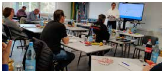
Seilflechter Schulungsraum Teillansicht

Der schnellste Weg zu uns führt über das Autobahnkreuz BS-Nord (A2) Richtung Norden Lüneburg-Gifhorn. Abfahrt Wenden-Bechtsbüttel, rechts Richtung Möbelhaus MÖMAX, an der Kreuzung links abbiegen, Straße Am Beberbach (Richtung Bienrode).